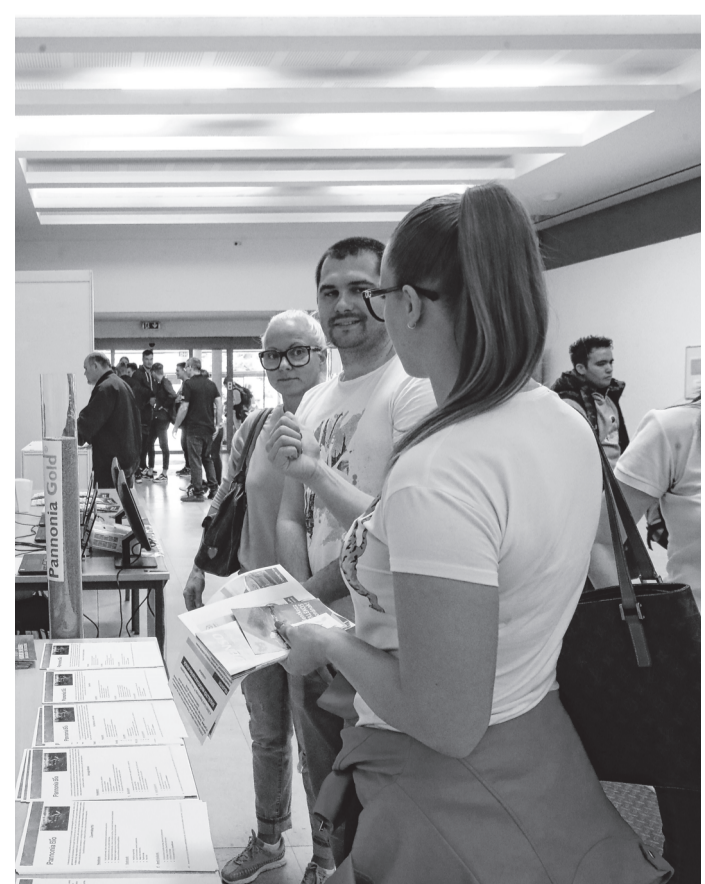
Előadásokon és standokon ismerkedhettek a résztvevők az ajánlatokkal

A cél az, hogy mielőbb gondolkodni kezdjenek azon, milyen cégnél szeretnének dolgozni, megismerjék, milyen információk fontosak egy-egy vállalkozásról a döntéshez, ez már az egyetemi, szakképzési duális képzés során is jól jöhet. KK