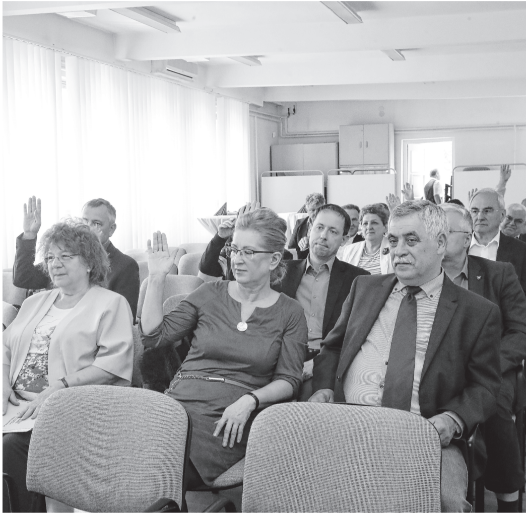
Elfoglaltak a vállalkozók, a küldöttek döntő többsége mégis jelen volt az ülésen

A kamara titkára kitért a Mediaworks TOP 100+400 kiadványának megyei adataiból kinyerhető helyi gazdaságot jellemző számokra is. A megye ötszáz legnagyobb árbevételű vállalkozásából 59 dunaujvárosi, illetve a város közvetlen környezetébe tartozó (tehát 12 százalék). Árbevétel tekintetében viszont ezek a cégek harmadát teszik ki a megye listában szereplő vállalkozásainak, export vonatkozásában ez az arány még magasabb, negyven százalék. Ez az adat is mutatja, hogy mi-